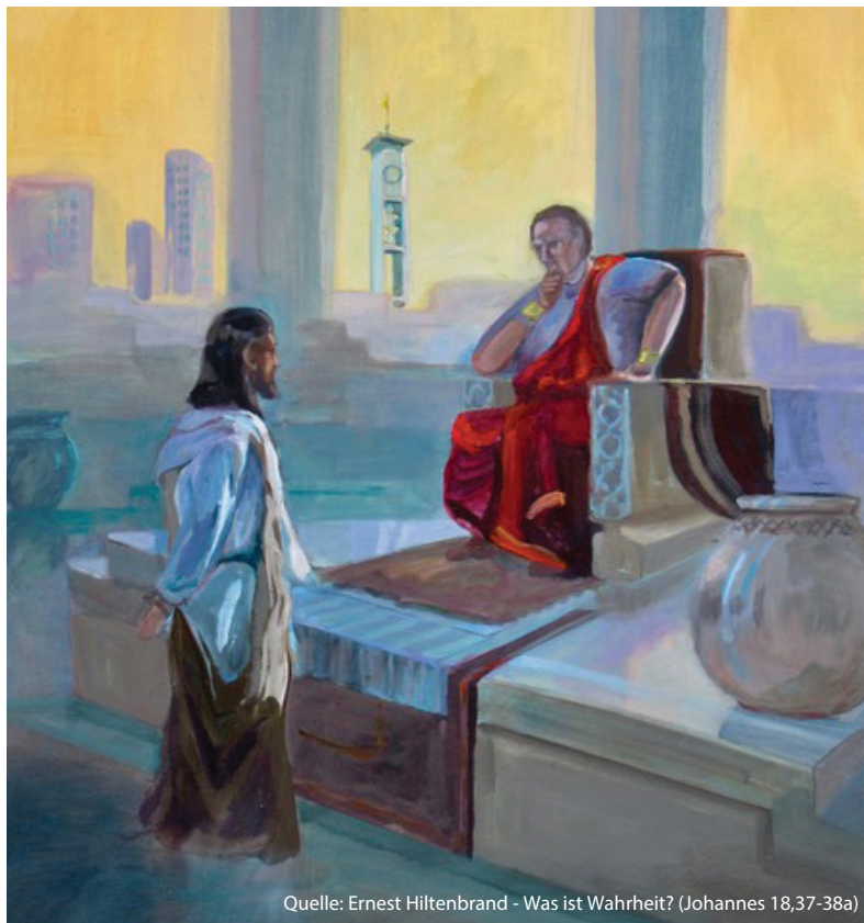
Quelle: Ernest Hiltenbrand - Was ist Wahrheit? (Johannes 18,37-38a)