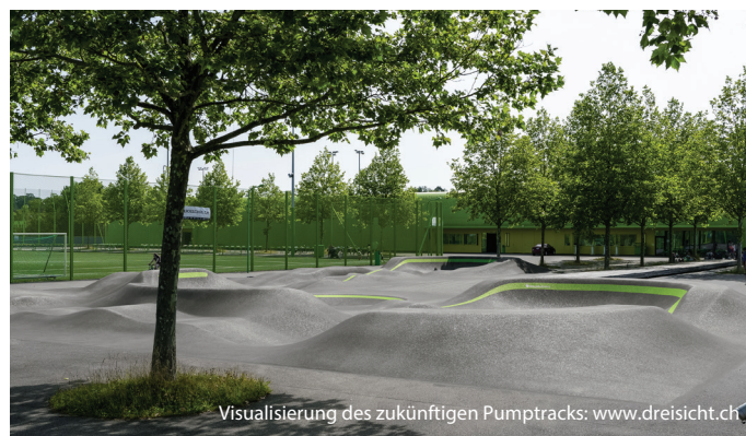
Visualisierung des zukünftigen Pumptracks: www.dreisicht.ch

Wir sind ganz nah dran, endlich den Pumptrack für Familien in Schwamendingen zu bauen! Wir freuen uns, dass wir die Baufrei-gabe erhalten haben und Anfang Mai der Baustart erfolgen kann! Mehr Informationen zur Geschichte und dem Projekt unter: www.pumptrack-hirzenbach.ch