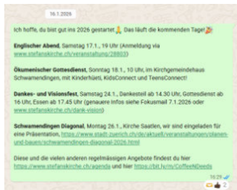
Beispiel einer Nachricht im InfoChat von Anfang Jahr.