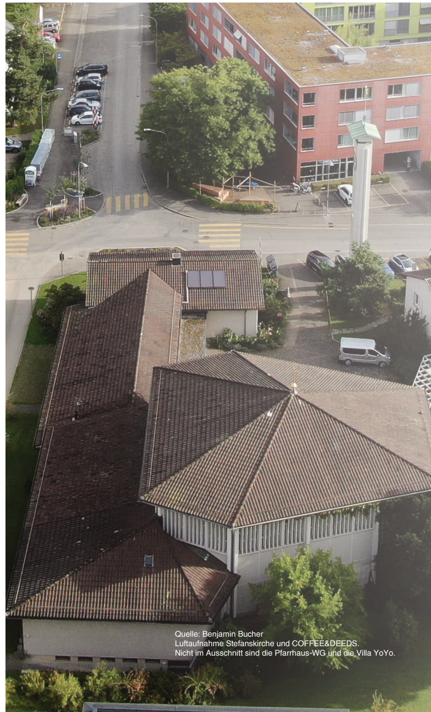
Luftaufnahme Stefanskirche und COFFEE&DEEDS. Nicht im Ausschnitt sind die Pfarrhaus-WG und die Villa YoYo.

Insgesamt bietet die Studie keinen abschliessenden Befund, sondern eine Einladung zur gemeinsamen Reflexion. Sie bietet Anlass, um für unsere bestehenden Stärken dankbar zu sein! Lasst uns auch darüber reden, wie wir offener werden können für die Begegnung mit Menschen aus anderen kulturellen und weltanschaulichen Kontexten, bewusster auf die Umwelt schauen und Schätze der kirchlichen Tradition wie Taufgedenken und Beichte in unser Gemeindeleben einbauen können. Ein Gespräch, das wir aufnehmen sollten. Für die Kirchenpflege, Thomas Bucher